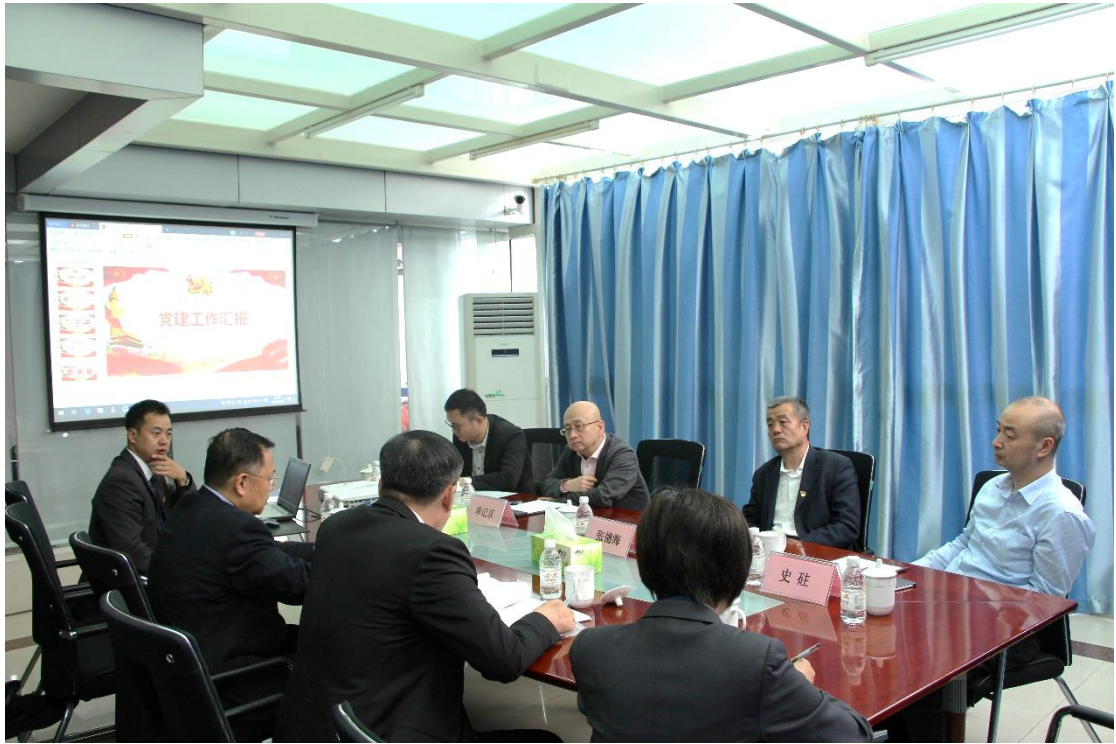
與單記京組長開會